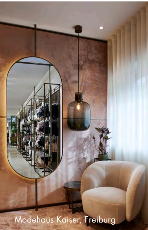
Modehaus Kaiser, Freiburg

Realisierung von Verkaufsflächen und Markenwelten