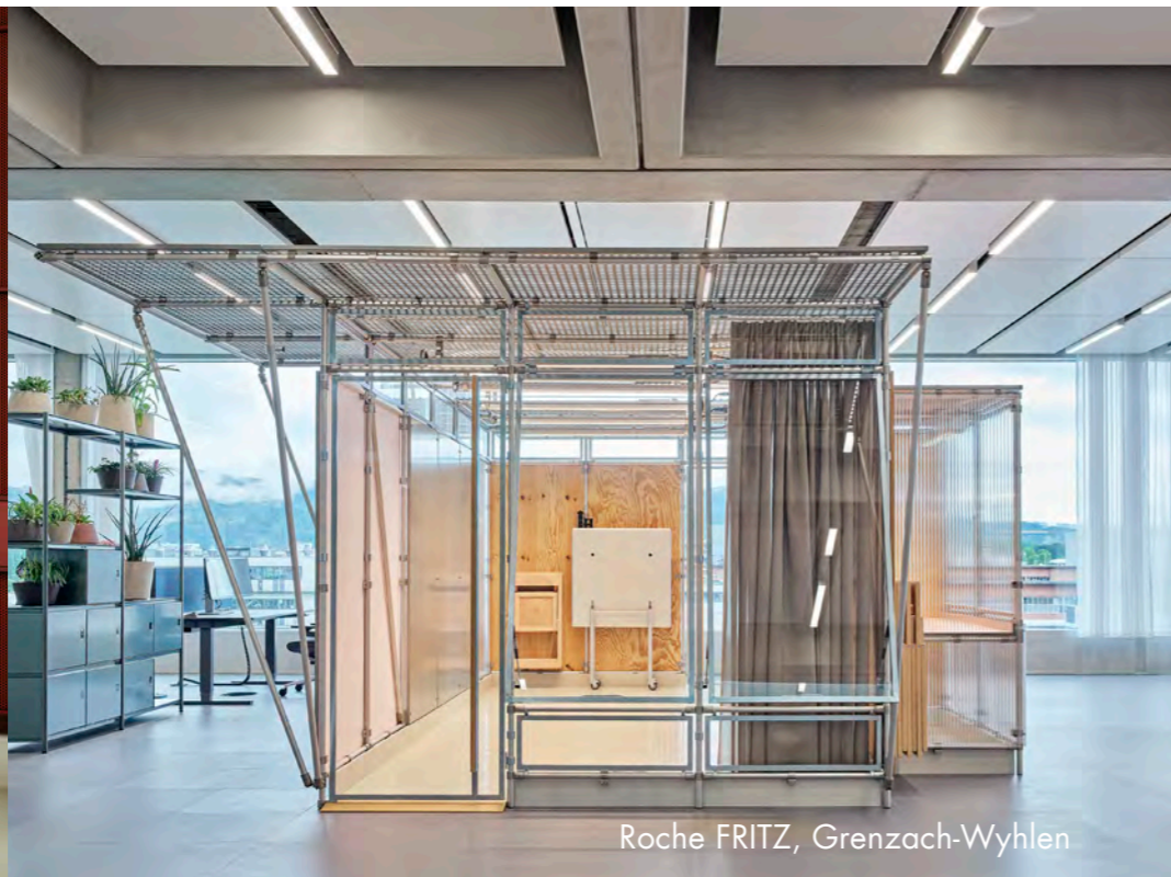
Roche FRITZ, Grenzach-Wyhlen