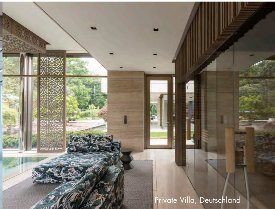
Private Villa, Deutschland