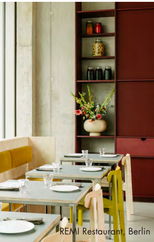
REMI Restaurant, Berlin

Innenausbau im gewerblichen oder öffentlichen Bereich