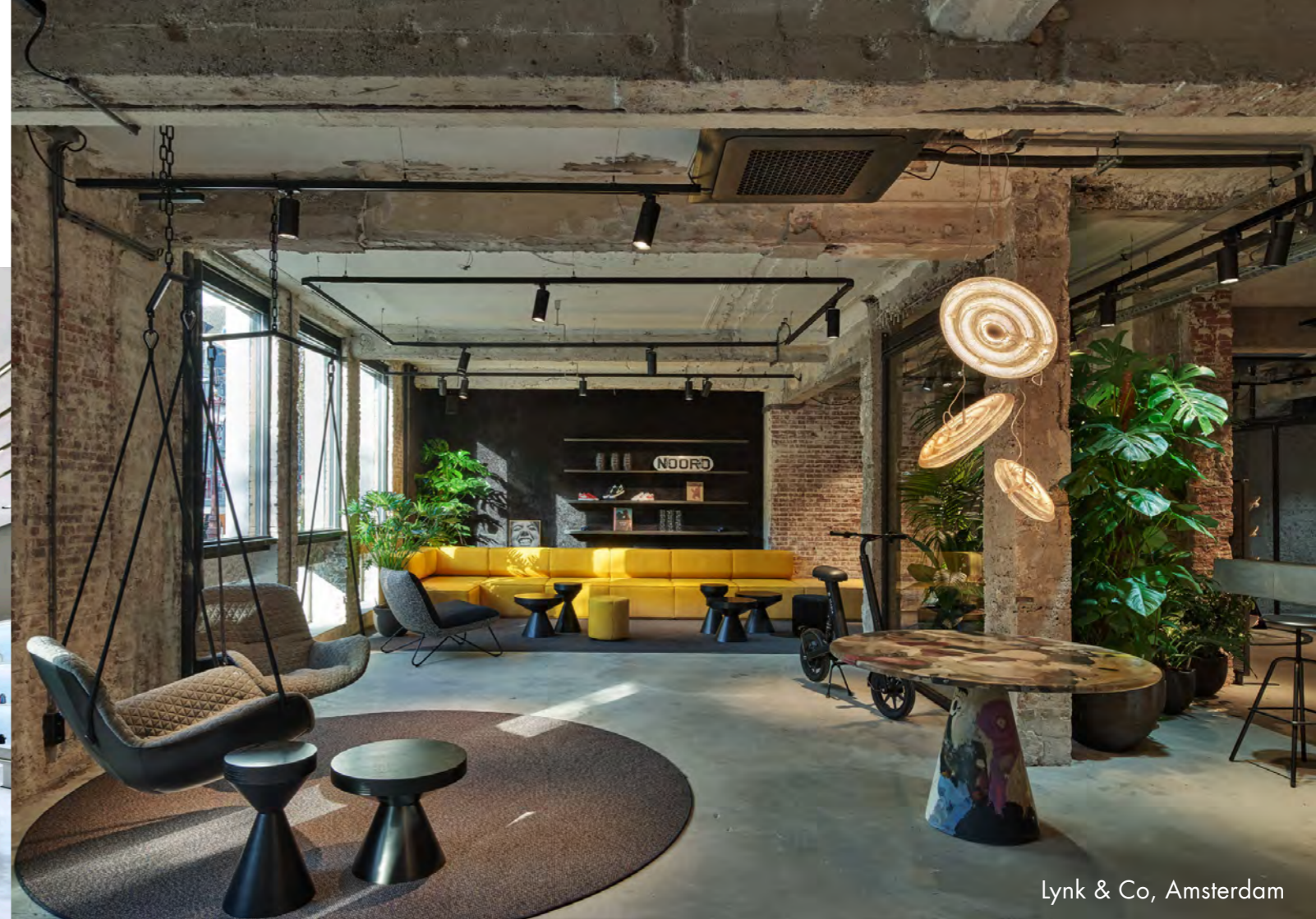
Lynk & Co, Amsterdam